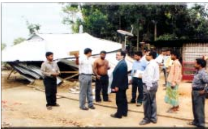
Officers & Staff of the State Legal Services Authority along with District Secretary, DLSA West & PLVs visiting the cyclone affected village

On 2 nd May, 2012 a devastating cyclone hit few villages at Bishalgarh and the villagers lost their huts, cattles, valuables including identity cards, job cards of MGNREGA , Passports, books of school going children, title deeds etc. Officers & staff of the TSLSA and DLSA, West along with PLVs visiting the affected villages on 04-05-2012 for providing Legal Aid to the victims of the disaster .