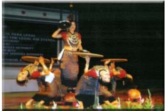
Artists performing 'Hojagiri Dance' at the seminar at Nazrul Kalakshetra, Agartala on 28-04-2012.