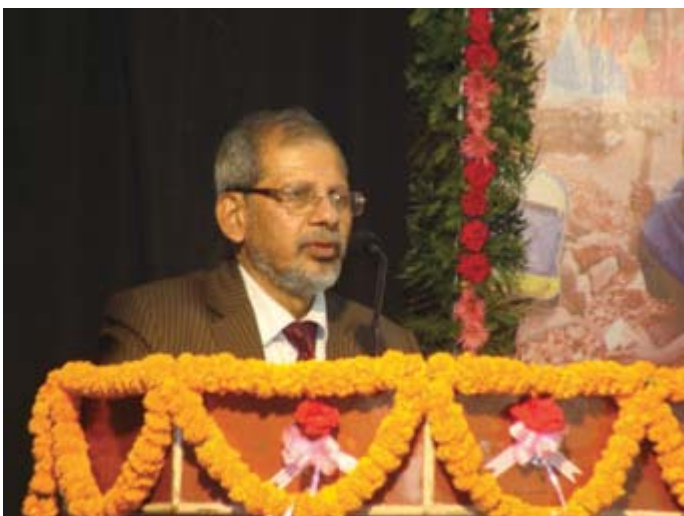
Hon'ble Mr. Justice U. B. Saha, Judge, Gauhati High Court, addressing the audience in the Seminar.