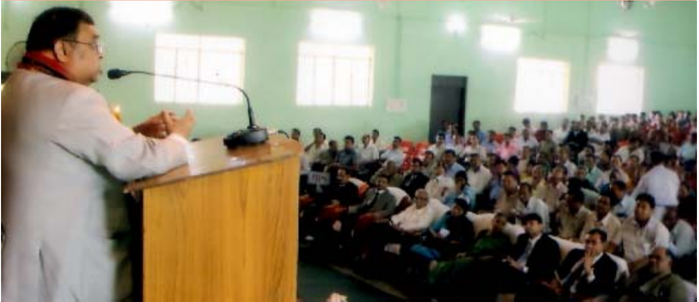
Hon'ble Mr. Justice Altamas Kabir, Judge, Supreme Court of India addressing the audience on 28-04-2012 in 'Nuai' Auditorium at TTAADC heatquarters, Khumulwng on the occassion of inauguration of Legal Aid Clinic.