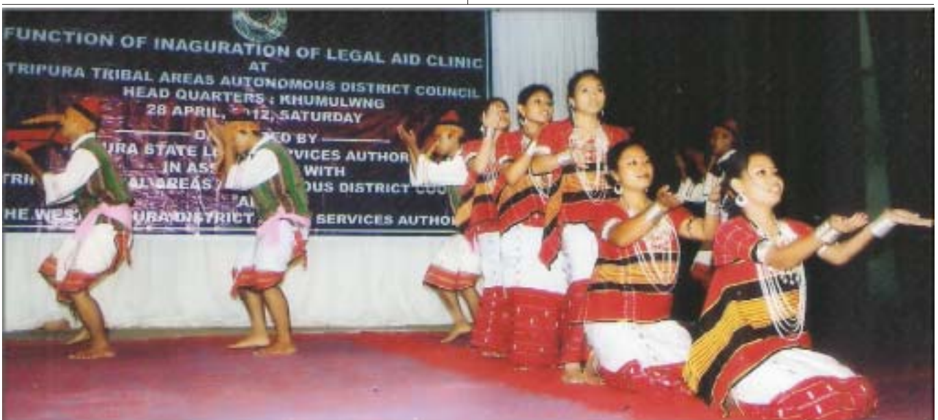
Artists performing Tribal dance in 'Nuai' auditorium at TTAADC headquarters, Khumulwng on the occasion of inauguration of Khumulwng Legal Aid Clinic on 28-04-2012