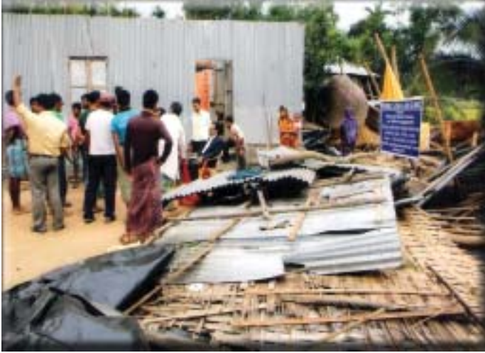
A cyclone affected village of Bishalgarh