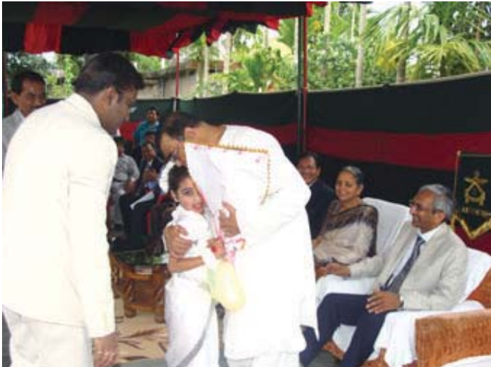
From the album of the State Legal Services Authority

Hon'ble Mr. Justice Altamas Kabir with a child artist at the venue of the laying of the foundation stone of the District ADR Center at Udaipur on 29-04-2012