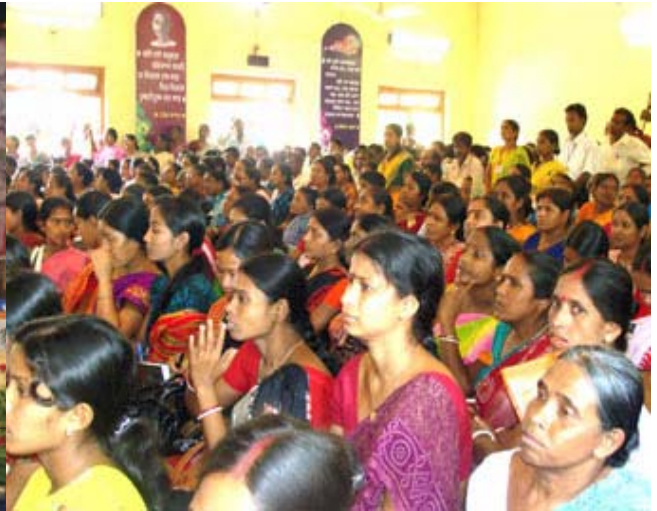
Hon'ble Mr. Justice Altamas Kabir addressing the audience in the seminar on "Mediation in Dispute Resolution - Its Importance and Usefulness" at the Town Hall, Udaipur on 29-04-2012.