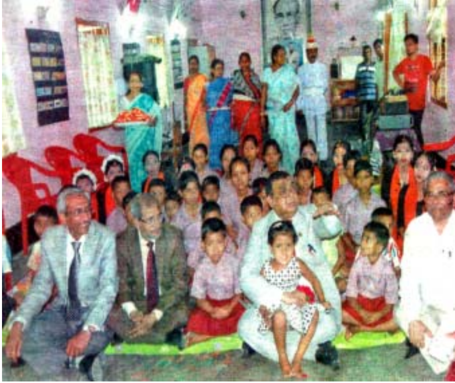
‘আমাদের ঘর’-এ আবাসিকদের সঙ্গে সুপ্রিম কোর্টের বিচারপতি আলতাভাস কবির এবং গুরাহাটি হাইকোর্টের প্রধান বিচারপতি এ কে গোয়েল। শনিবারে। নরসিংগড়ে।

Children’s Home are established and maintained by the State Govt. either by itself or in association with Voluntary Organisations for reception of child in need of care & protection under section 34 of the Juvenile Justice(care & protection of children) Act, 2000.