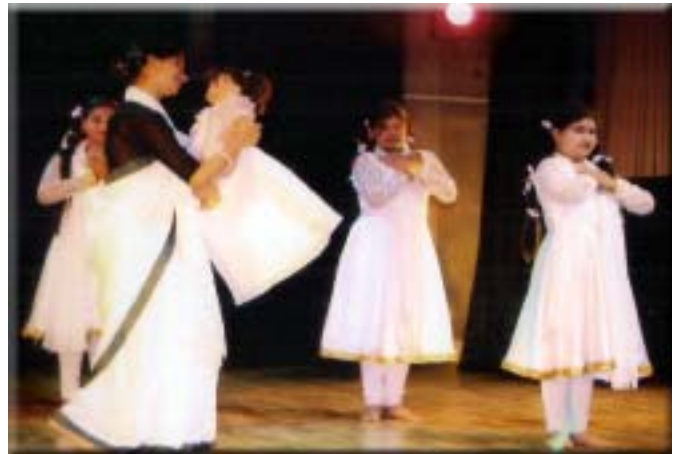
'Save the daughters', A thematic dance is being performed by the local artists at Nazrul Kalakshetra, Agartala on 28-04-2012 at the seminar on "The role of Para-Legal Voluneers in strengthening the Legal Aid System"