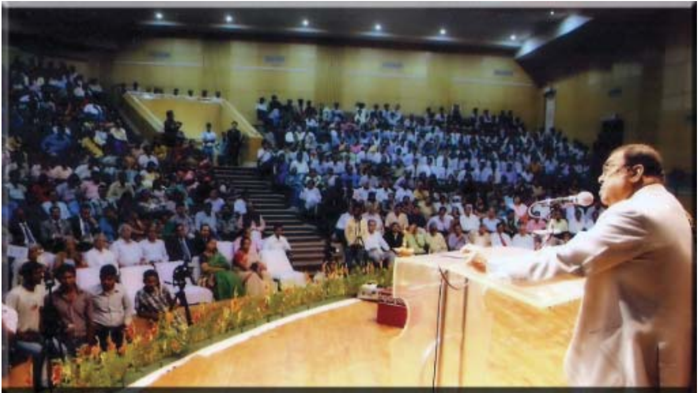
His Lordship Hon'ble Mr. Justice Altamas Kabir addressing the audience at Nazrul Kalashetra, Agartala on 28-04-2012, evening, on the 'Role of Para Legal Volunteers in strengthening the Legal Aid System.