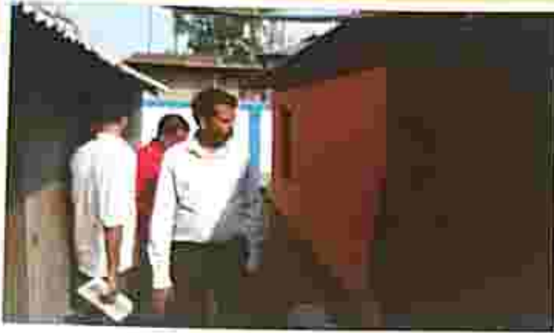
Visit at Children Homes at Unokoti District by District Secretary, DLSA, Unokoti District.