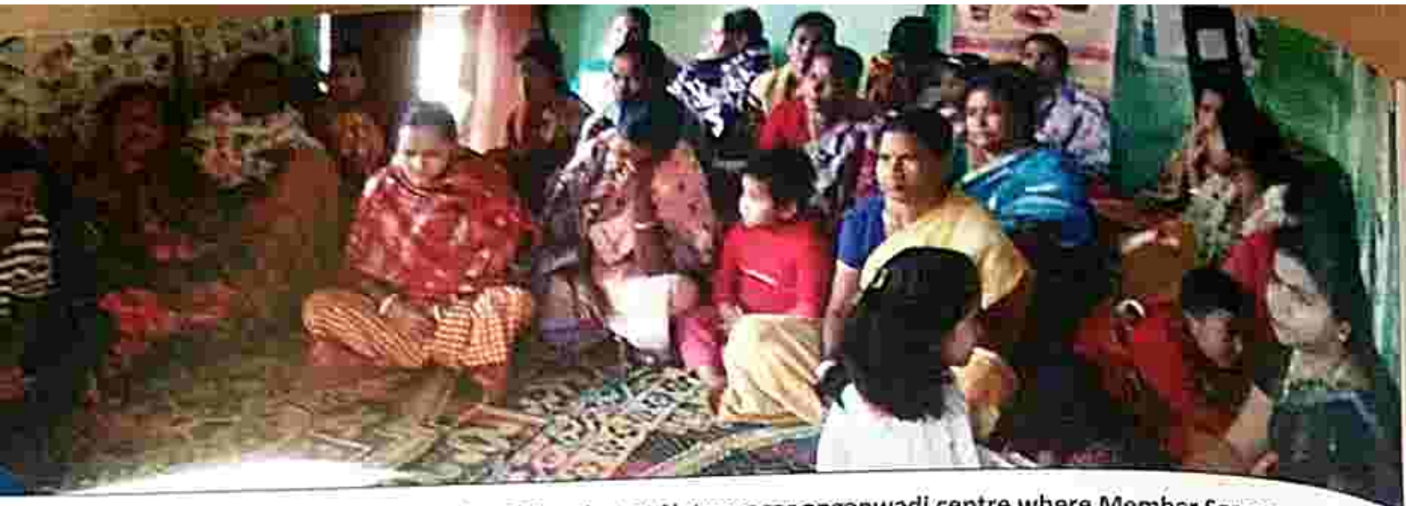
Legal awareness programme under AZJ project at Natunnagar anganwadi centre where Member Secretary, TSLSA, District Secretary DLSA, West Tripura visited the clinic and attended the programme.