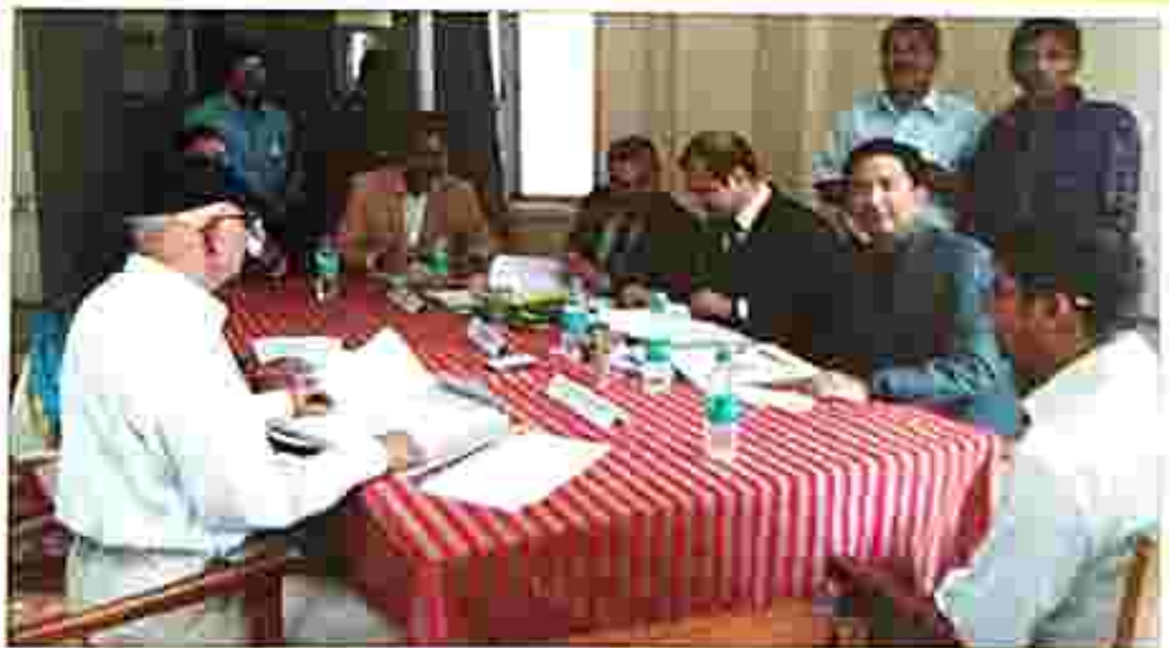
National Lok Adalat at High court by HCLSC on 9 March 2019.