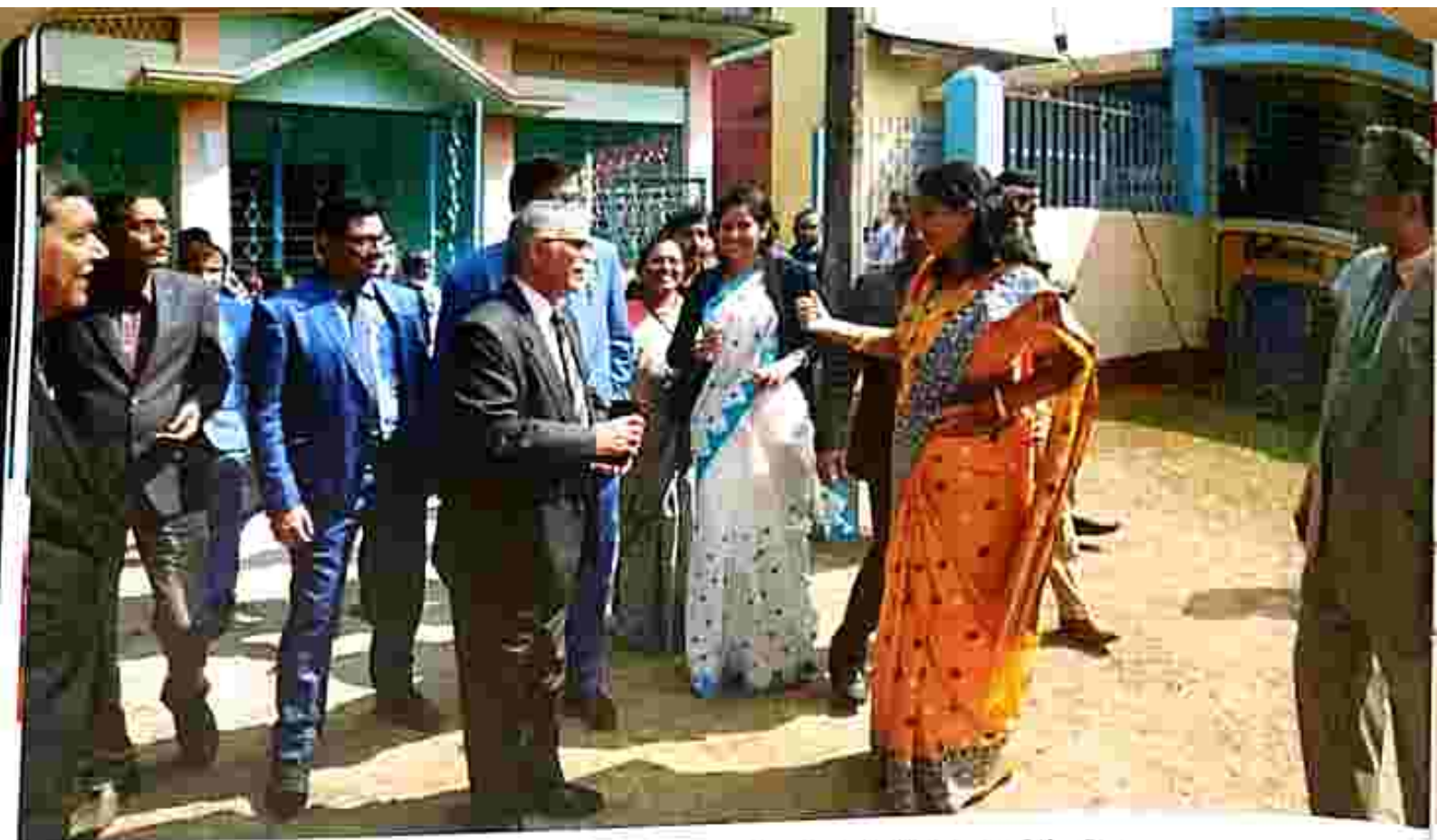
Hon'ble the Patron-in-Chief interacting with Id. Members of the Bar.