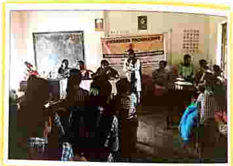
On 29 March 2019 legal awareness programme held at Khamting bari ADC village by SDLSC, Khowal.

Following activities were conducted during the month of March, 2019, by our Authorities/committees throughout the State: