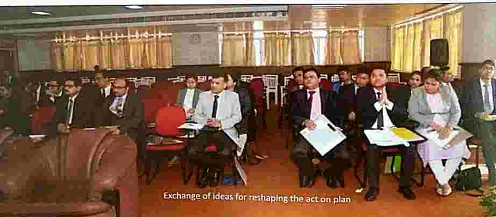
Exchange of ideas for reshaping the act on plan