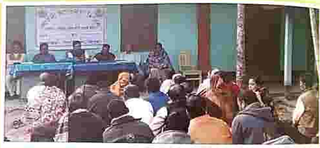
Legal awareness programme on 6 January 2019 at South Nalchar GP, Sunamura.