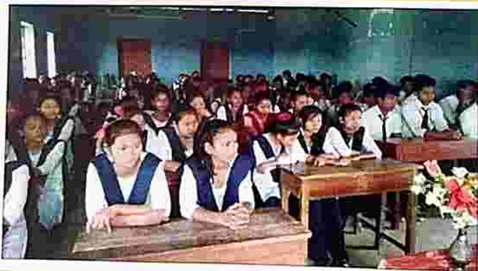
Legal awareness programmes organised by Legal literacy club, under SDLSC Belonia.