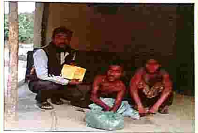
Ration card handed over to poor family by PLVs of South Tripura Districts.