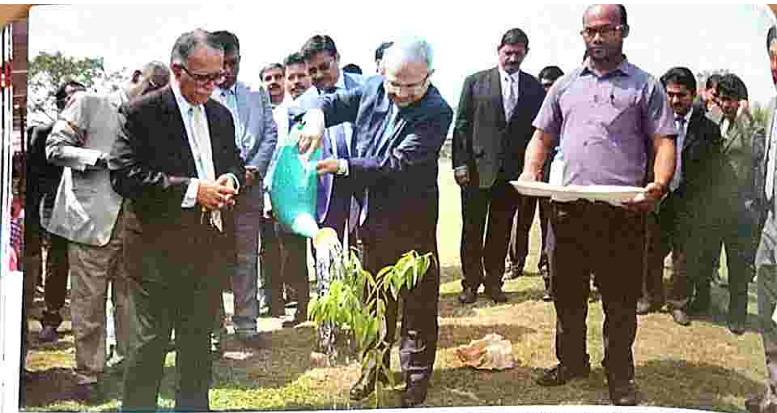
Planting a sapling on the occasion of the Seminar on 'Man has failed The Constitution' in the High Court of Tripura