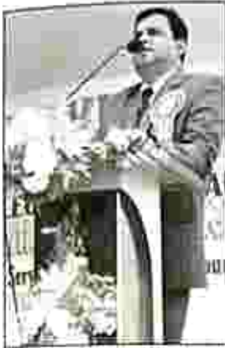
কিল্লা ব্লকে আইনি পরিষেবা শিবির। রবিবার।