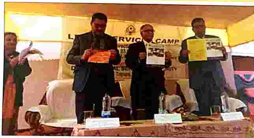
Information booklet in Bengali language was released by their Lordships