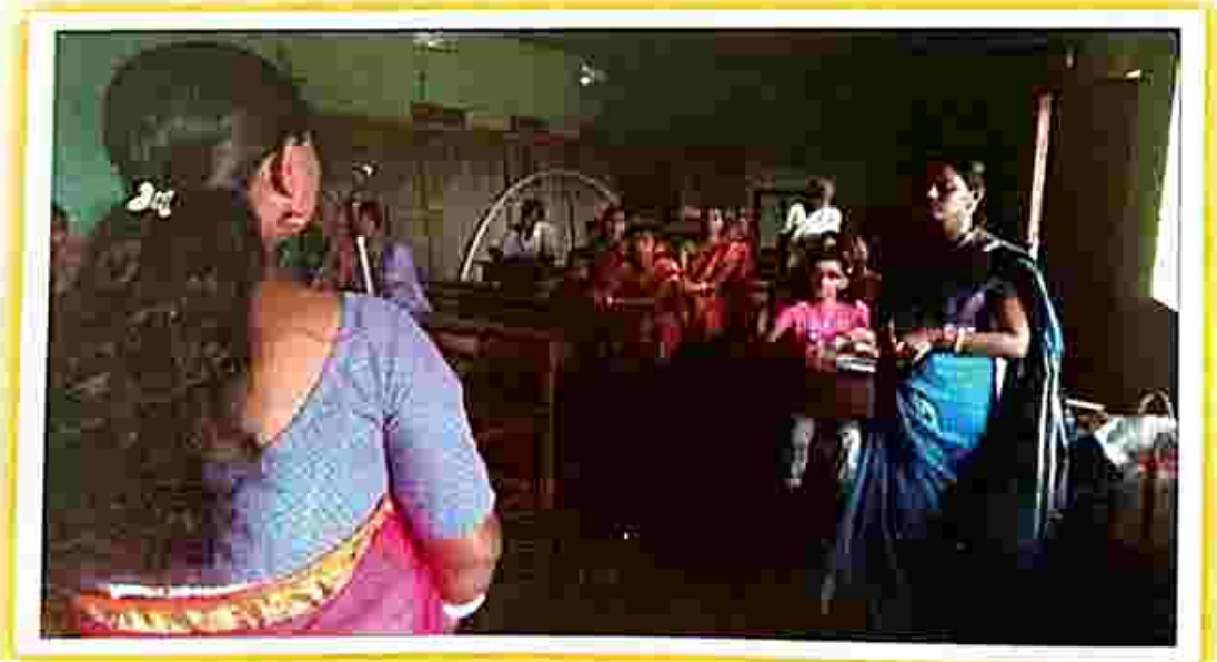
Legal awareness programme at Belonia