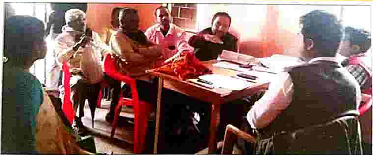
A few glimpses of the Special Lok Adalat proceedings held on 20th January 2019