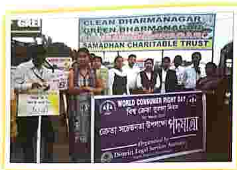
On 15 th March 2019, Rally on World Consumer right day by DLSA, North Tripura.