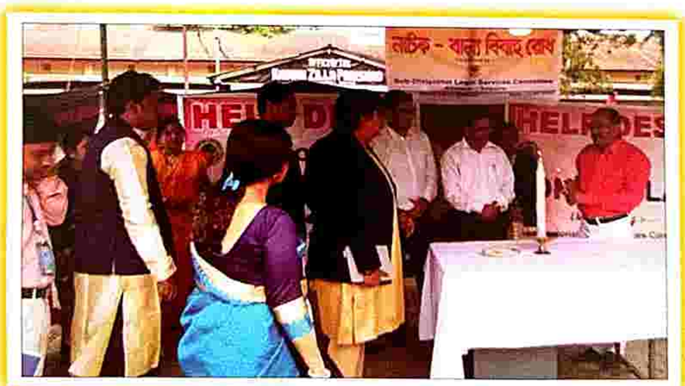
Inauguration of a Play/Drama on 'prevention of Child Marriage' organized by the SDLSC, Khowai Tripura

On 17.02.2019, under DLSA South Tripura, SDLSC Sabroom, SDLSC Khowai, SDLSC