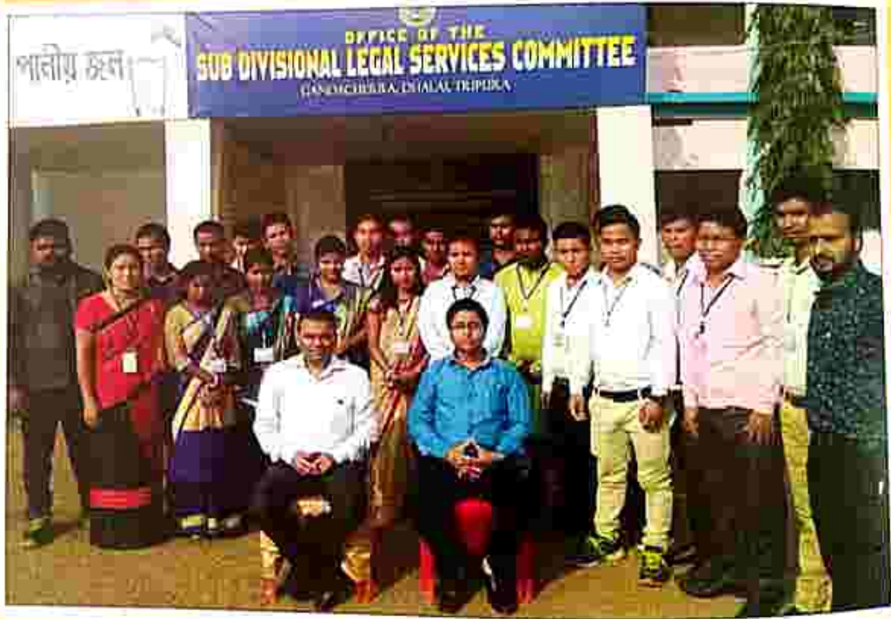
Group photo of staff members and PLVs whose tiresome efforts made the programme successful, with Id. Member Secretary TSLSA and Id. Member Secretary SDLSC, Gandacherra, Dhalai Tripura