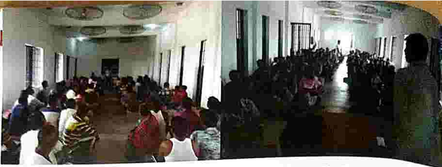
On 22 March 2019 a legal awareness programme organised by Sunamura SDLSC at Sunamura Sub-Jail.