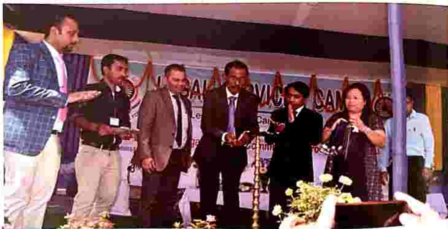
Inauguration of Legal Services Camp at Manughat, Sabroom