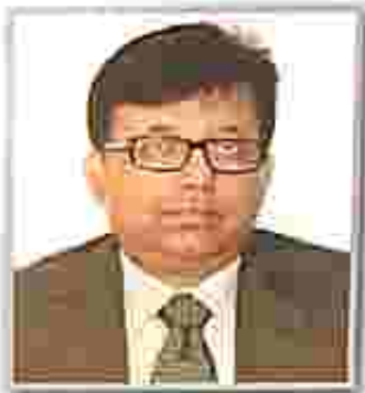
Hon'ble Mr. Justice S. Talapatra, Judge, High Court of Tripura & Hon'ble the Executive Chairman, TSLSA