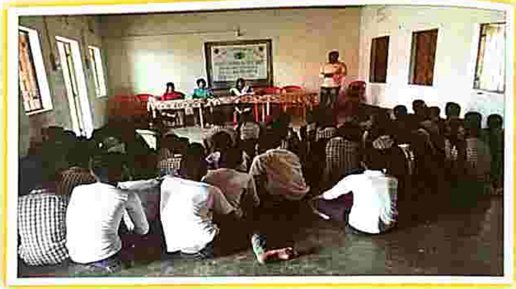
Legal literacy club at Bishaigar on 20 March 2019.