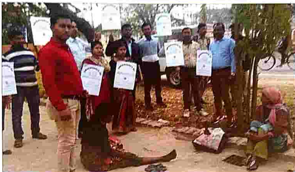
Rally and rescue of a Mental patient from road side on the disabilities day of 'Social Justice on 20 February 2019