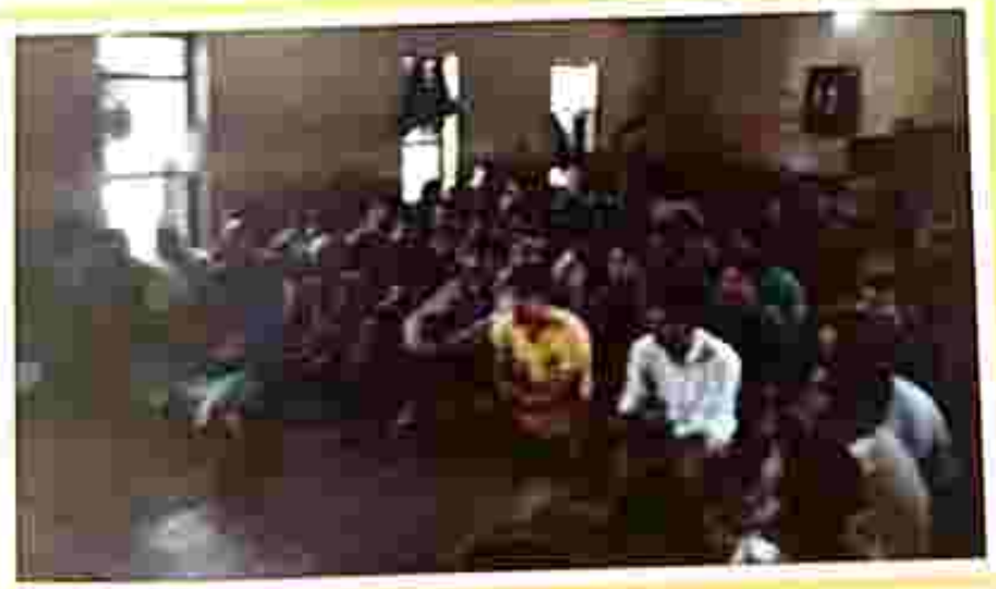
Legal awareness programme on Plea Bargaining at Dharmanagar Sub-Jail on 15 March 2019.