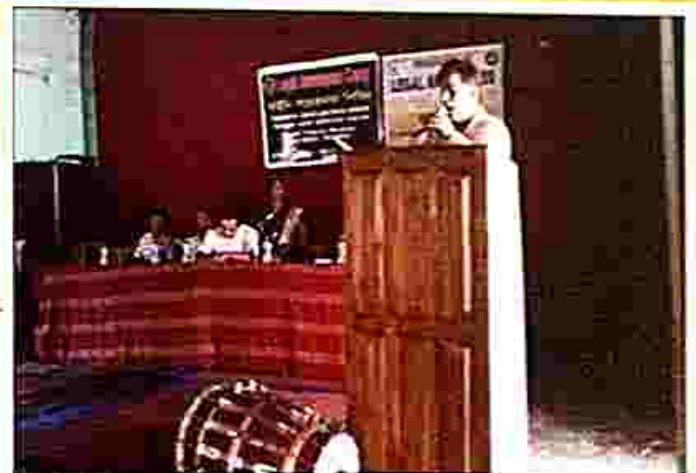
School students attending to legal awareness camp at a school in Belonia.