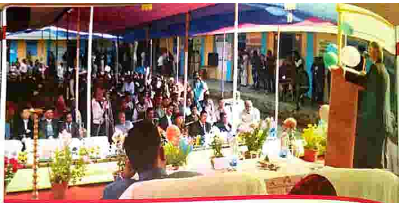
Patron-in-chief addressing the gathering