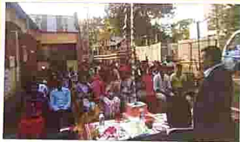
Awareness programme and Distribution of Marriage certificates at Gaidhigram G.P under DLSA West Tripura District. The I/L Member Secretary, DLSA inaugurated programme in presence of District Secretary, DLSA West Tripura on 30 January 2019.