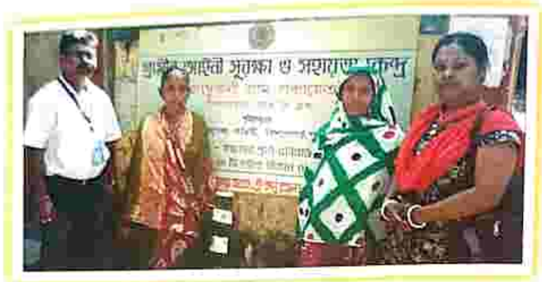
Counselling at Lembutali village legal care and support centre under SDSC, Bishalgar.