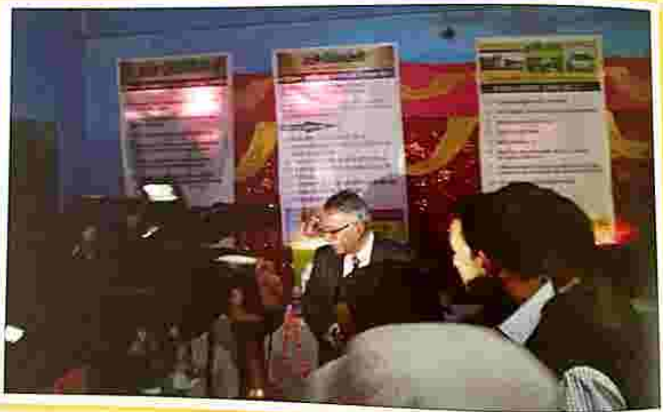
Patron-in-Chief during stall visit