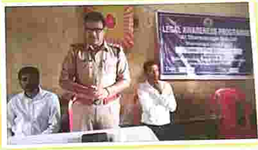
A police officer describes how to reach them in need