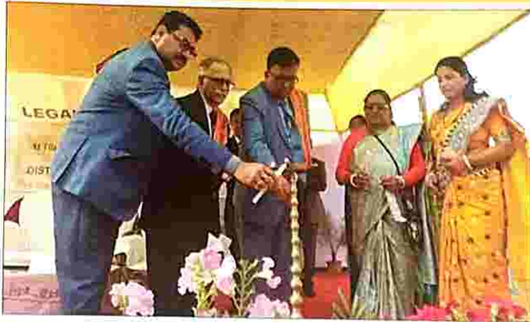
Lightening of lamp by Hon'ble Judges, The High Court of Tripura in the inaugural programme of Legal Services Camp at Kailasahar