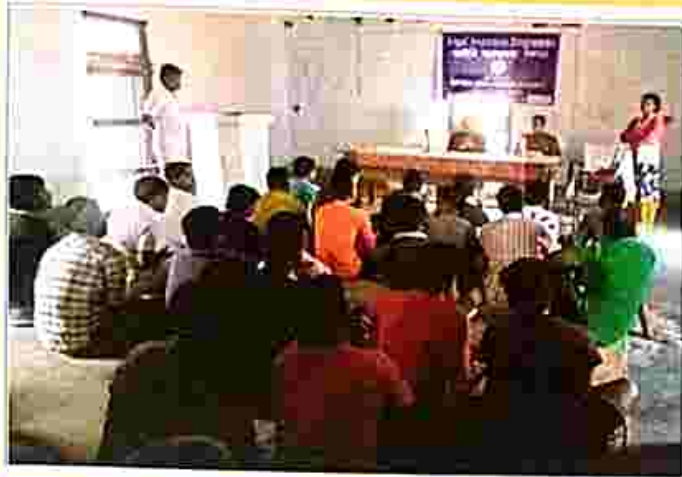
Legal services camp organised by DLSA, Gomati at Udaipur Jail.