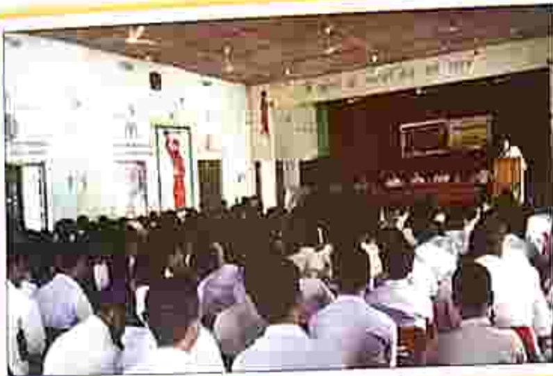
Legal awareness programmes organised by DLSA, Belonia, South Tripura District.