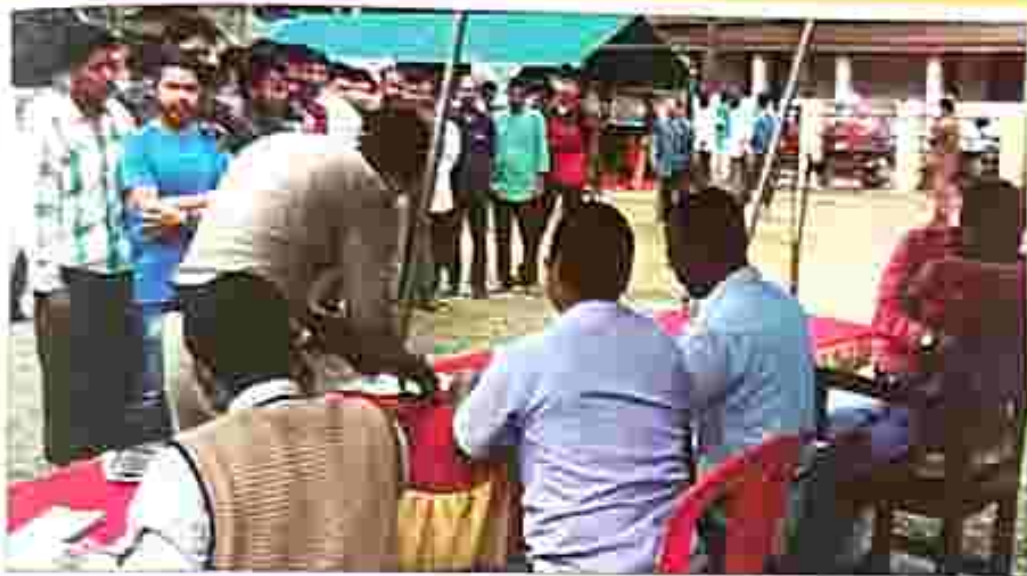
People gathered on National Lok Adalat at Chowk on 5 March 2019.