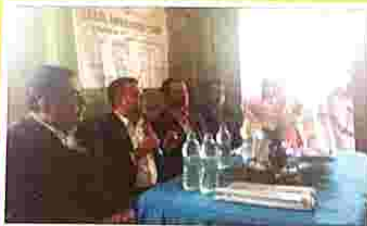
Legal awareness programme under A2I project at Natunagar anganwadi centre where the Member Secretary, DLSA, The District Secretary, DLSA, West Tripura visited the clinic and attended the programme.