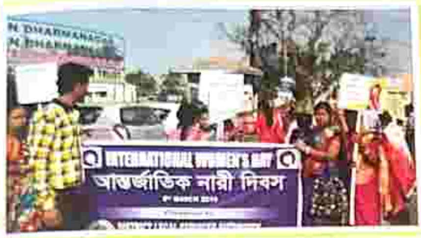
Rally on International Women's Day, organized by CLSA, North Tripura on 8 March, 2019