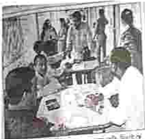
জাতীয় লোক আদালত। প্রতিবেদন: ইন্দ্রজিত কুমার (সি. ডি. ডি. ডি.)