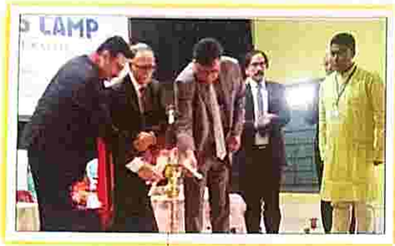
A few glimpses of the Legal Services Camp organized by the SDLSC, Gandacherra, Dhalai Tripura