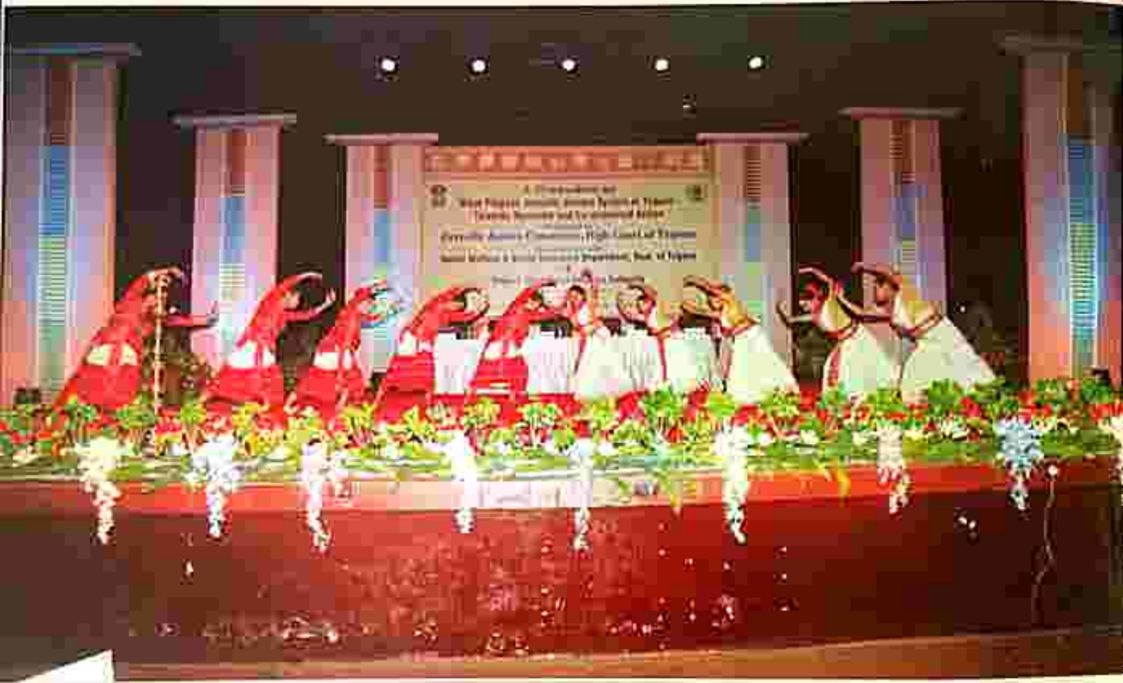
A classical dance programme performed by school students