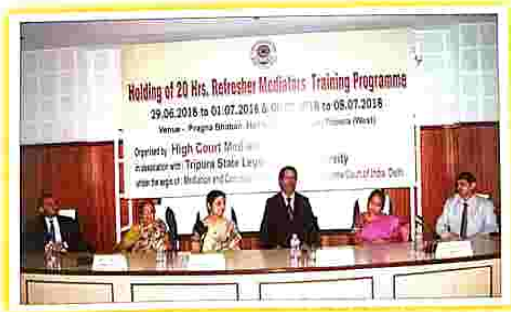
Senior Trainers from Tamil Nadu Mediation Conciliation Centre