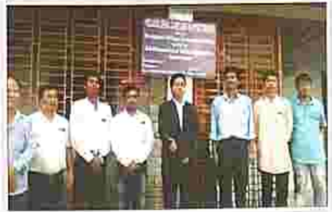
Opening of a Village Legal Care and Support Centre at Hatnagar and Dhakajhari Villages, the most interior places in Tripura