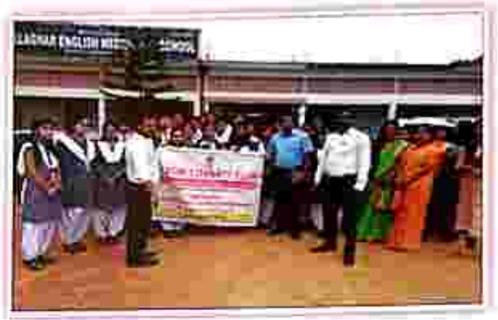
Legal Literacy (Llib) has been inaugurated in Melaghar English Medium School on 05.07.2018