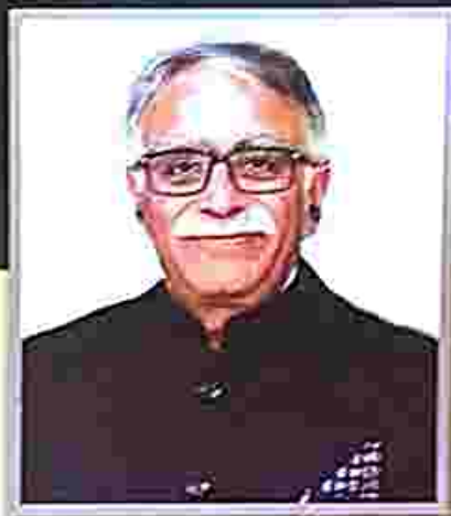
Hon'ble Mr. Justice Sanjay Karol, Chief Justice, Hon'ble High Court of Tripura & Patron in Chief, TSLSA

(1st July, 2018 to 30th September, 2018)