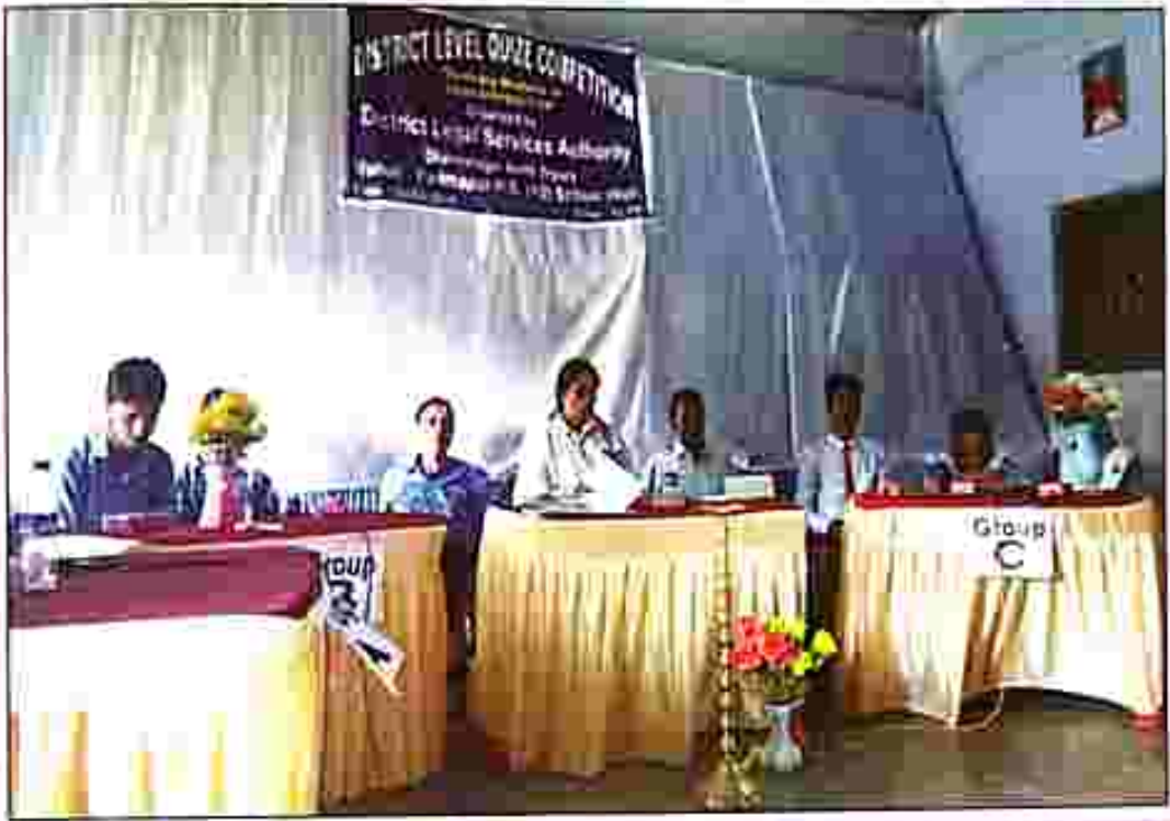
District Level Quiz competition involving the Legal Literacy Clubs organized by the DLSA, North on 20.09.2018