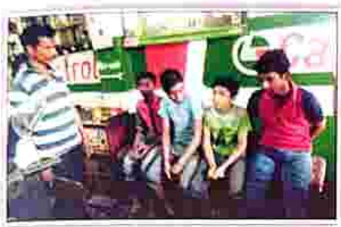
Recovery of Child Labour from a Workshop under South Tripura District, Belonia on 05-07-2018