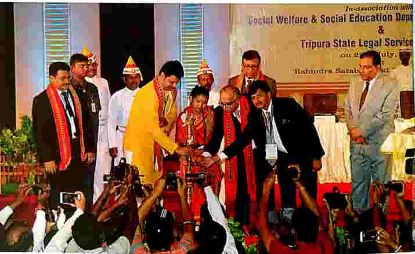
Lighting of the Inaugural Lamp by His Lordship, Hon'ble Mr. Justice Deepak Gupta, Judge, Hon'ble Supreme Court of India alongwith the Chief Minister, Tripura, Hon'ble the Chief Justice, High Court of Tripura and Hon'ble Minister, SW & SE Department, Hon'ble the Executive Chairman, TSLSA & Hon'ble the Chairman, HCLSG