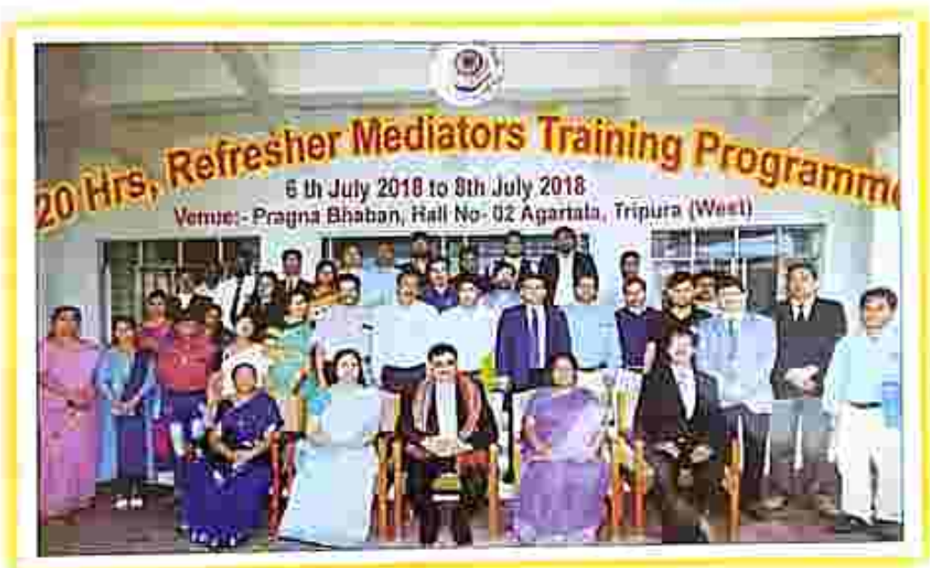
A group photo of the Mediators with the Chairman, HCLSC, High Court of Tripura alongwith the Trainers from outside state.

deputed 2 nos. of Senior Trainers from Tamil Nadu Mediation and Conciliation Centre as observers, 4 Nos. of Potential Trainers from Karnataka Mediation Centre and 1 Junior Trainer from Punjab, Chandigarh and Allahabad Mediation Centre were came as the trainers for each of the Training programmes.