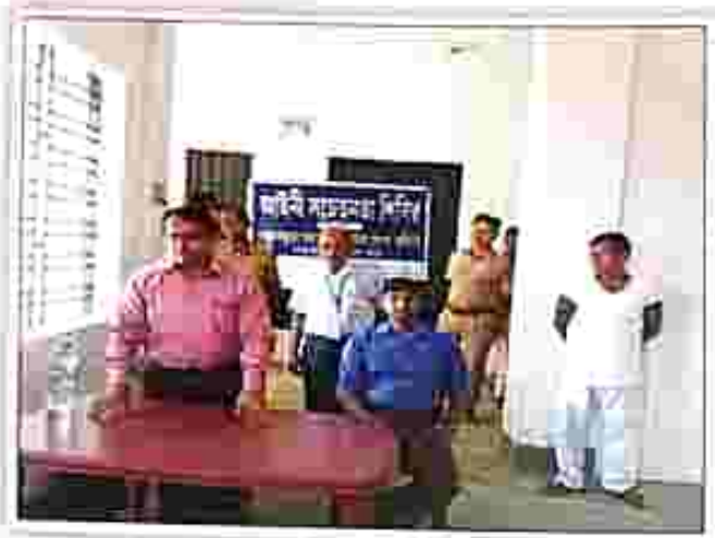
Legal awareness camp organized at Sonamura Sub Jail on 11.08.2018