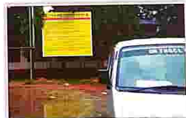
Udairpur Station : SDM Office (Nearby & K. Pur. P.S.)