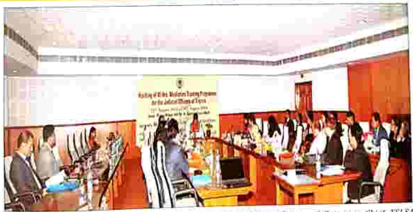
Deliberation of His Lordship Hon'ble the Chief Justice, High Court of Tripura & Patron-in-Chief, TSLSA during the Mediation Training session at Pragna Bhaban