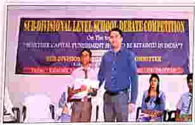
School level debate competition at Rajarshi, Udaipur on 04.08.2018.