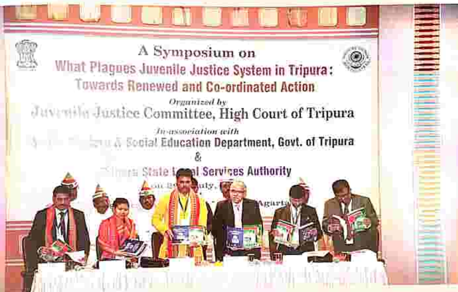
Release of Booklets prepared by TSLSA