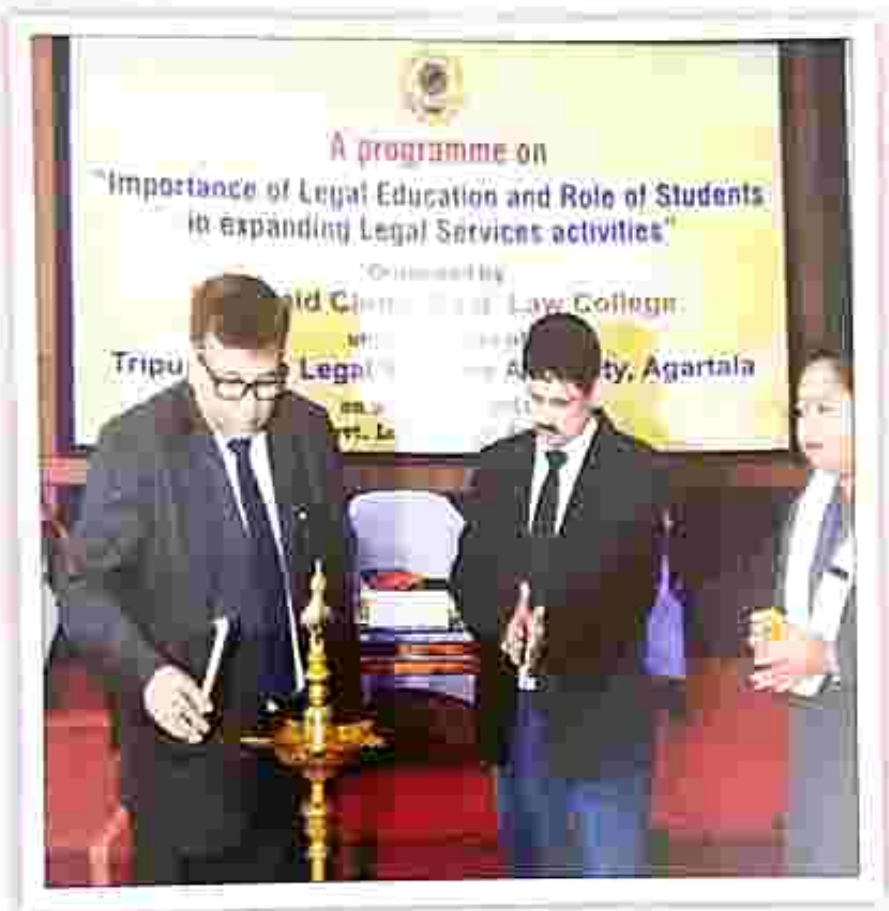
Inauguration of the programme by His Lordship, Hon'ble the Executive Chairman, TSLSA