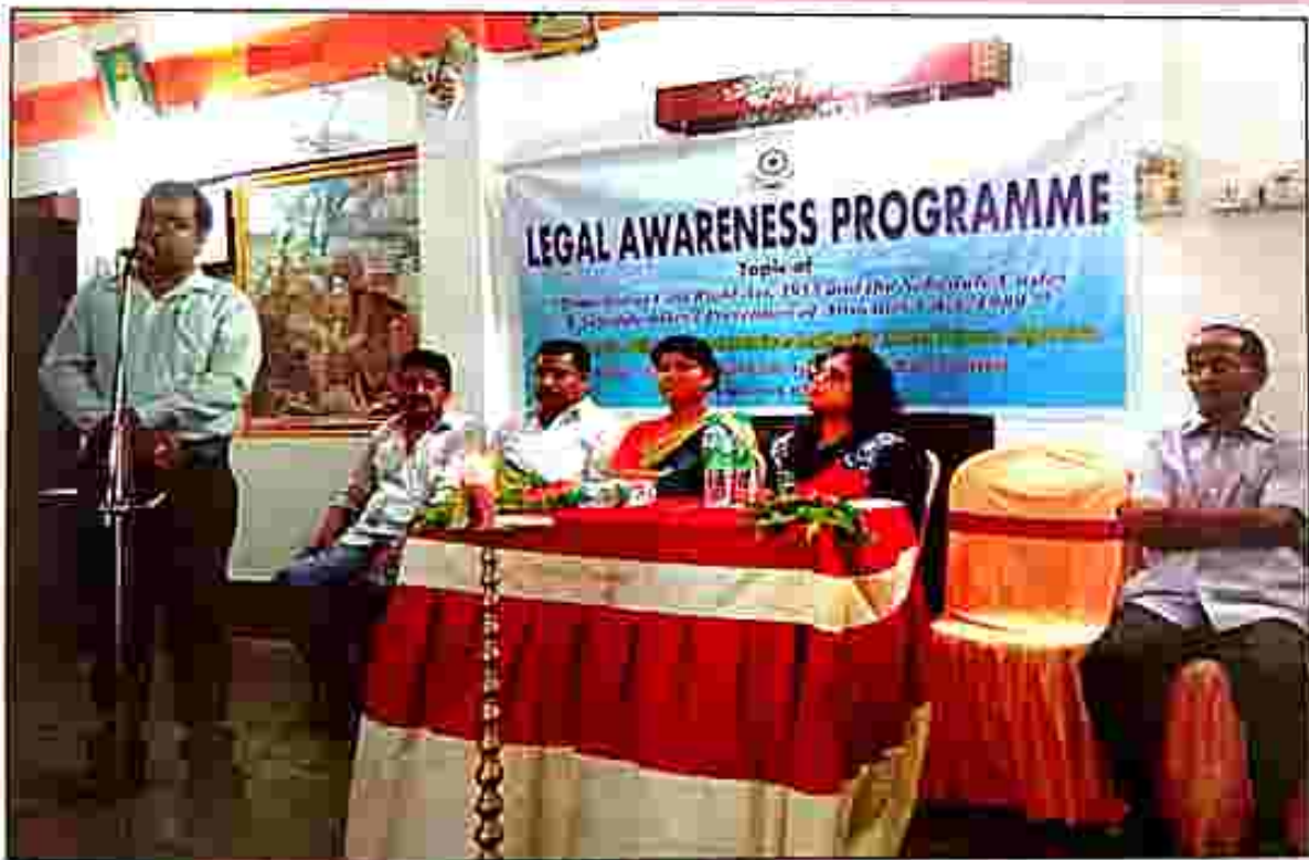
Legal awareness programme organized by DLSA, West on the topic of Protection of Civil Rights Act, 1955 and the Schedule Caste and Schedule Tribes (Prevention of Atrocities) Act, 1989 on 08.07.2018