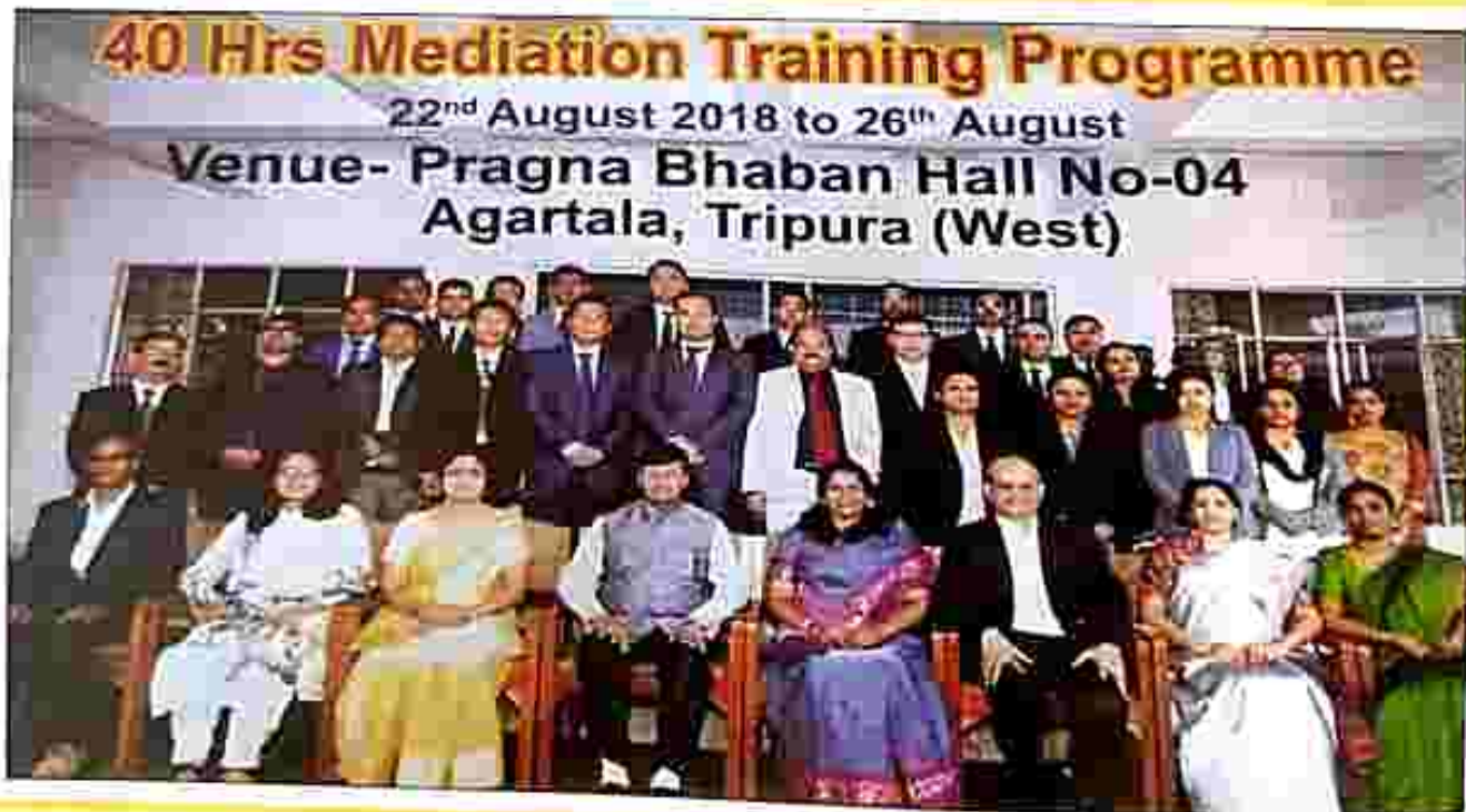
A group photo of the Judicial Officers as Mediators with His Lordship, Hon'ble the Chief Justice, High Court of Tripura & Patron-in-Chief, TSLSA alongwith the Trainers from outside state