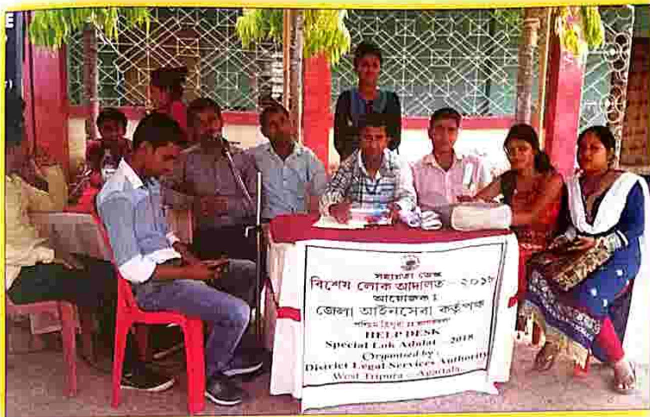
Help desk for the litigants on the day of Special Lok Adalat

Following are the activities conducted during the month of July, 2017, through the Authorities / Committees :