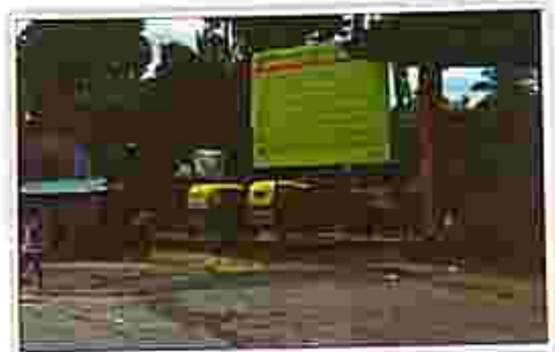
Belonia Station : Belonia Motorstand