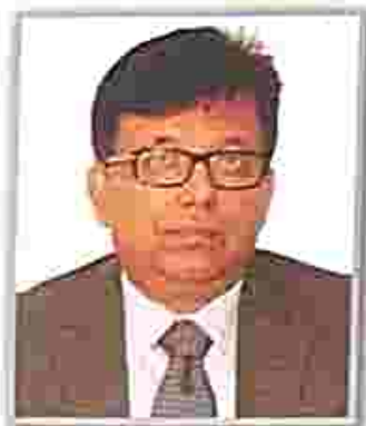
Hon'ble Mr. Justice S. Talapatra, Judge, High Court of Tripura & Hon'ble the Executive Chairman, TSLSA