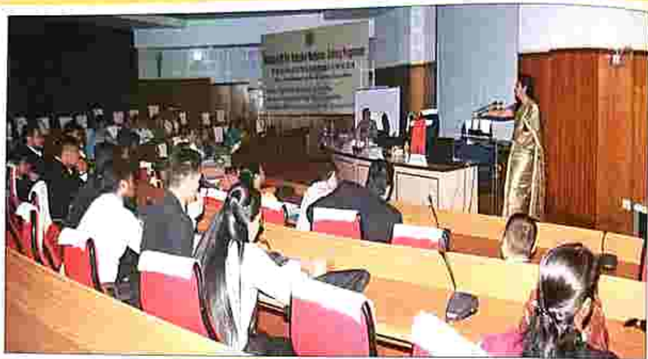
Mediation Training session.