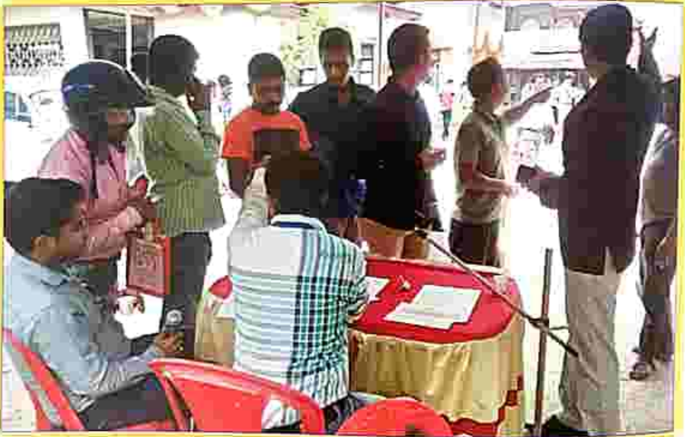
Help desk for the litigants on the day of National Lok Adalat

On 14.07.2018, National Lok Adalat was conducted as per guidelines of NALSA wherein 3296 numbers of cases were taken up for disposal in total 50 Nos. of Courts and out of that 436 nos. of cases were disposed of on settlement and a sum of Rs. 1,85,06,372/- was realized as settlement amount.