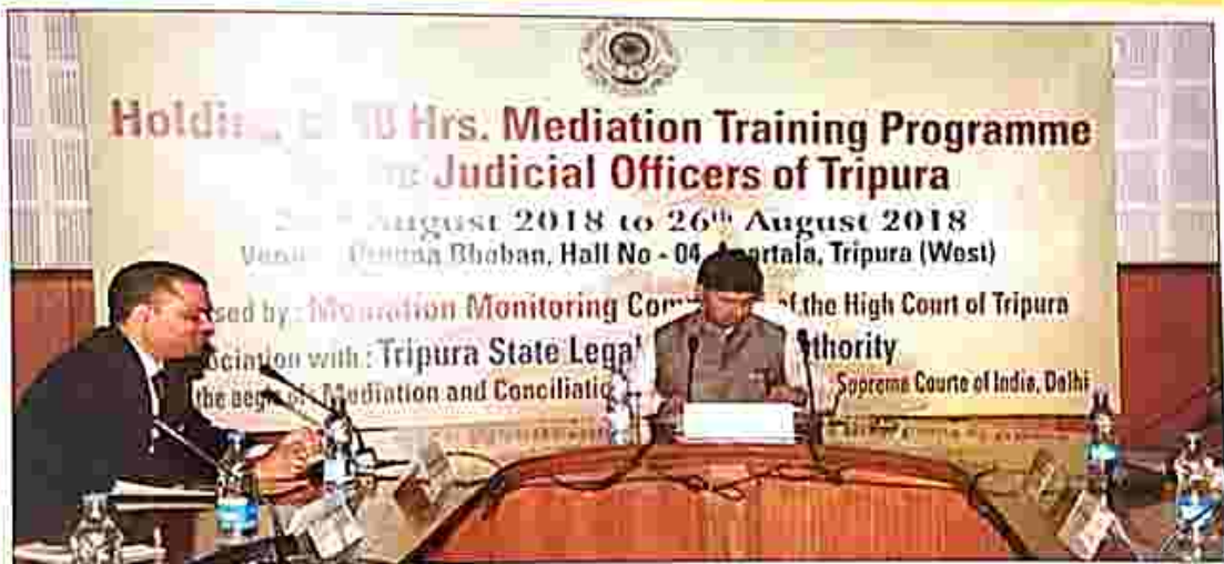
Speech delivered by His Lordship, Hon'ble the Chief Justice, High Court of Tripura & Patron in Chief, TSLSA Agartala during the training programme.

Following are the activities conducted during the month of August, 2018, through our Authorities / Committees :