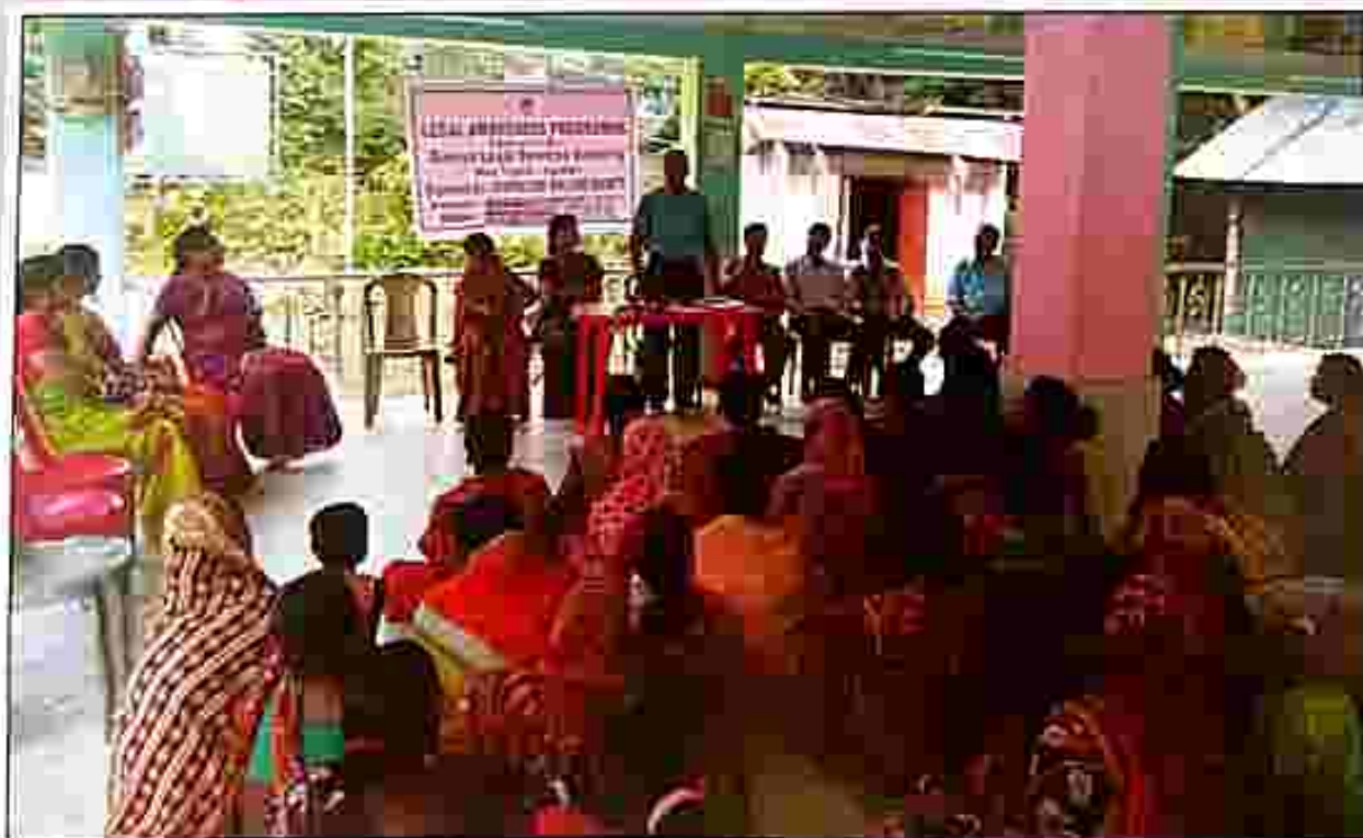
Legal awareness programme organized by DLSA, West at Mohanpur RD Block on 30.08.2018