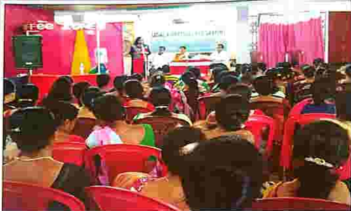
Legal awareness programme organized by DLSA, West on the topic of Protection of Civil Rights Act, 1955 and the Schedule Caste and Schedule Tribes (Prevention of Atrocities) Act, 1989 on 08.07.2018