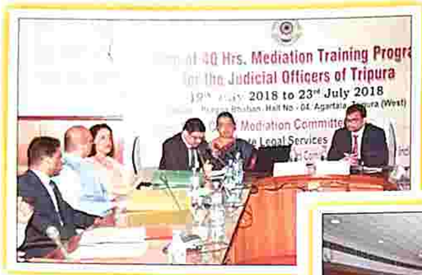
During the sessions of Mediation Training Programme