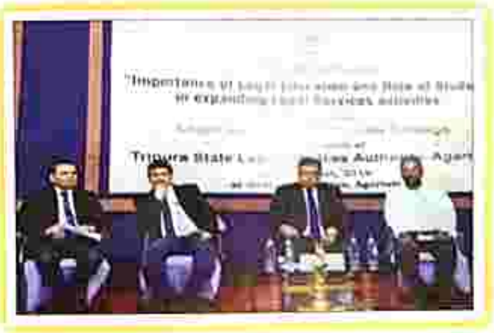
Interaction sessions going with College students and the dignitaries on the dais