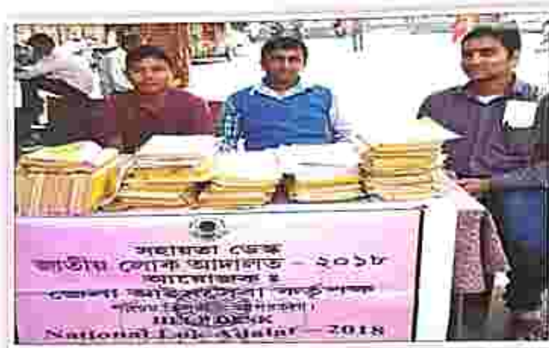
Help Desk set up for the 4th National lok adalat at Agartala court premises on 8 September 2018

On 08.09.2018, National Lok Adalat was conducted as per guidelines of NALSA wherein 3497 numbers of cases were taken up for disposal in total 46 Nos. of Courts and out of that 467 nos. of cases were disposed of on settlement and a sum of Rs. 2,08,23,420/- is realized as settlement amount.