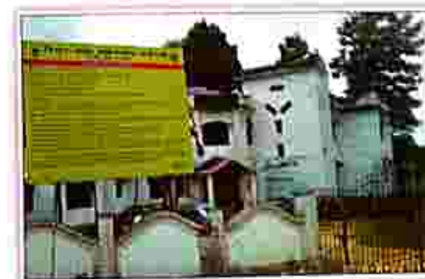
Sabroom Station : In front of Sabroom Court