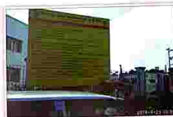
Amarpur Station : Amarpur Motorstand