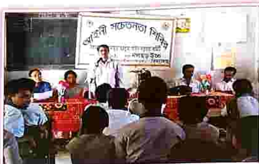
Legal literacy programme held at Nakhar high secondary school.