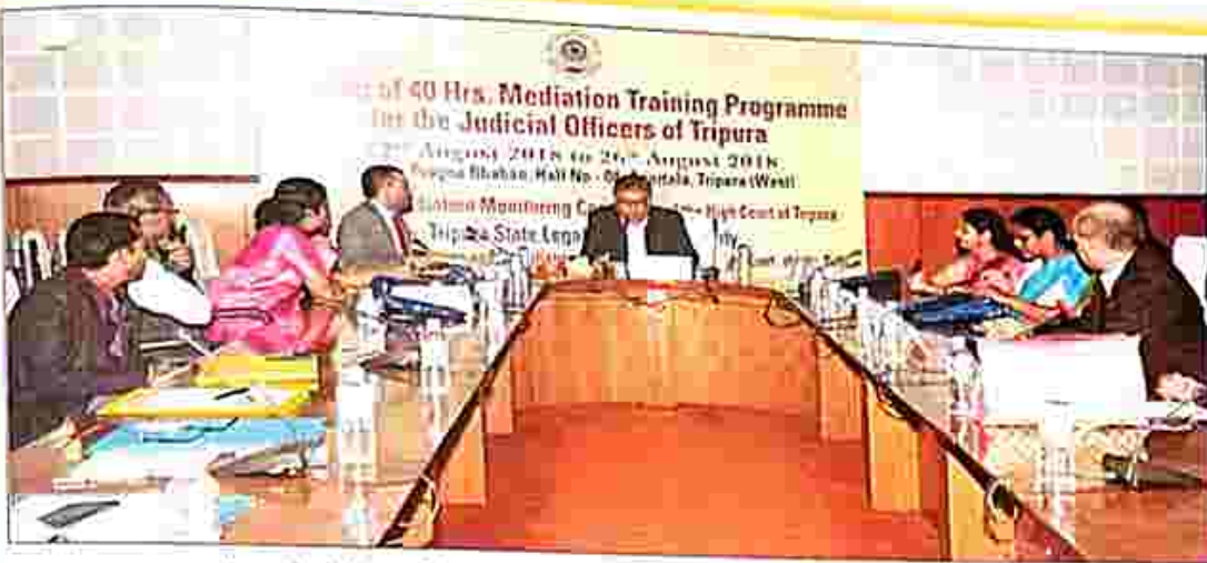
Speech delivered by His Lordship, Hon'ble the Executive Chairman, TSLSA during the training programme