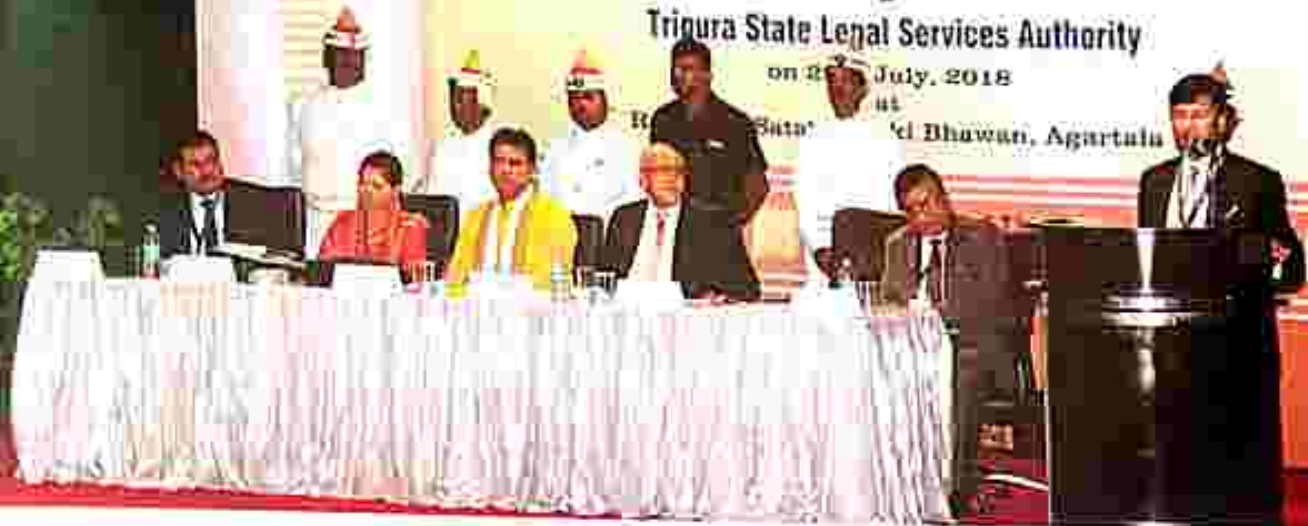
Speech delivered by His Lordship, Hon'ble the Chief Justice, High Court of Tripura, Agartala