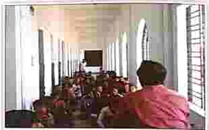
Setting up of a Legal Literacy Club at Melghar HS School on 06.07.2018