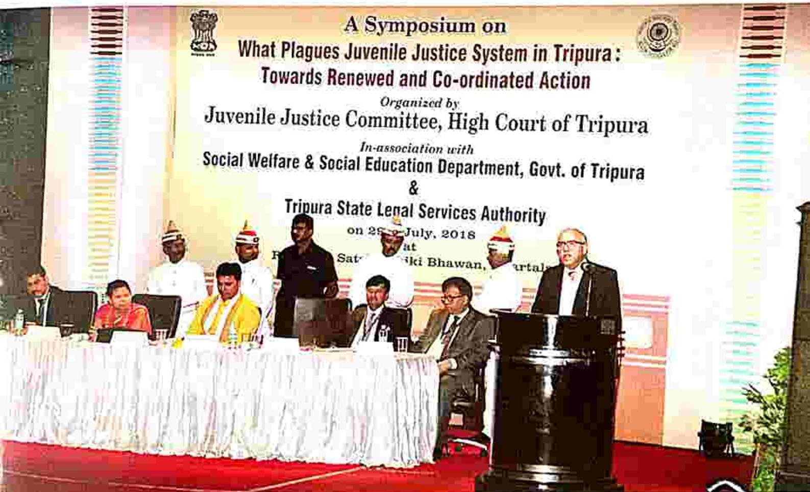
Speech delivered by His Lordship, Hon'ble Mr. Justice Deepak Gupta, Judge, Hon'ble Supreme Court of India

Agartala. The programme was inaugurated by His Lordship, Hon'ble Mr. Justice Deepak Gupta, Judge, Hon'ble Supreme Court of India & by Hon'ble the Chief Minister, Tripura in the august presence of His Lordship, Hon'ble the Chief Justice, High Court of Tripura & Hon'ble Judges, High Court of Tripura, Hon'ble Minister SW & SE Department and other Dignitaries.