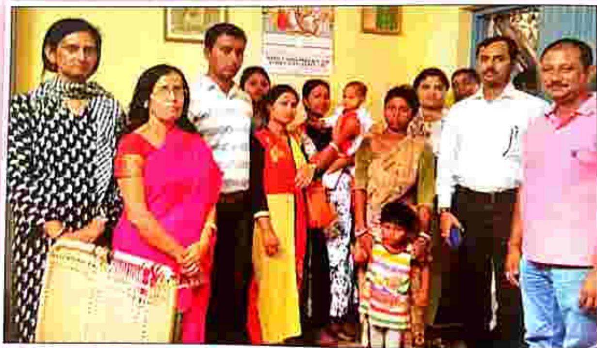
Rescued children hand over to a children home at Symali bazaar.