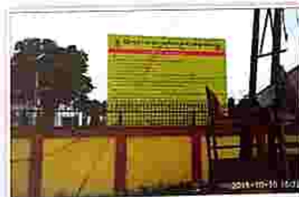
Bishnupur Station : In front of DM Office, Hishrangani