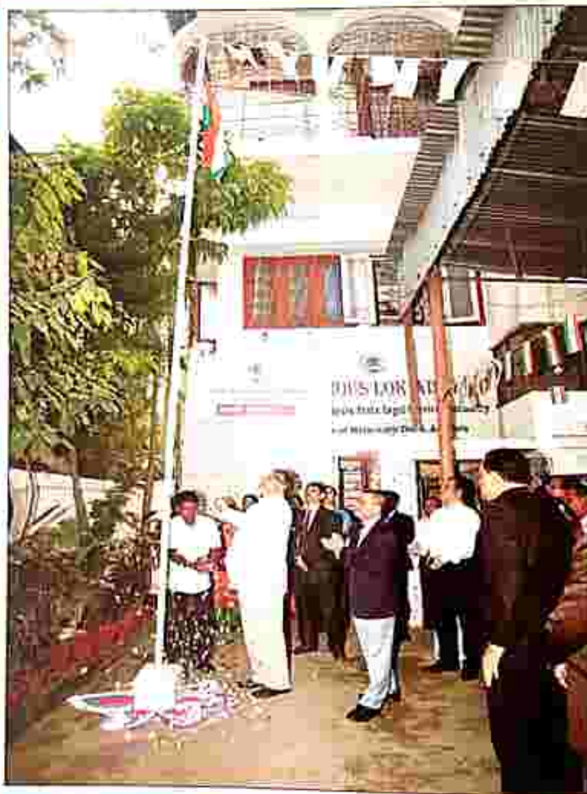
Hoisting of National Flag by His Lordship, Hon'ble the Executive Chairman, TSLSA in the august presence of other dignitaries in the office premises of Tripura State Legal Services Authority, Agartala on 15.08.2018

Celebration of Independence Day, 2018 on 15 th August, 2018