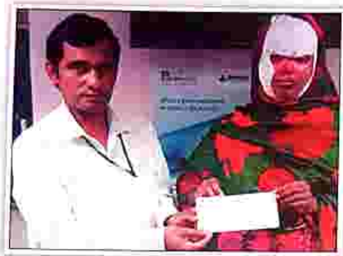
Monetary Award given to victim lady under victim compensation act / Opening of a Legal Literacy Club at Melghor HS School on 06.07.2018

Some of the other important photographs of the programmes conducted by the Legal Services Institutions of Tripura w.e.f 01.07.2018 to 30.09.2018 are given below: