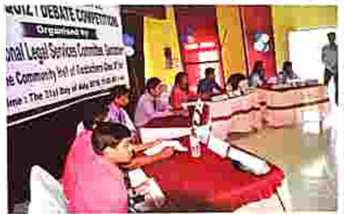
Organizing Quiz / Debate / Essay competition on 31.07.2018 (including the students of different schools) under Gandacherra Sub Division