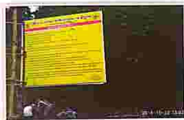
Bishnupur Station : At Maidhapur Bazar, Kambhagar Road

In implementing the direction of NALSA dated 17.05.2016 for wide publicity and visibility of works of the State Legal Services Authorities, we started fixation of 93 Nos. of Flex Hoardings in three phases containing legal services information in different prominent locations of different stations of the State. Under the first phase, 30 numbers of hoardings have already been fixed in different prominent places under Gomati District, Udairpur, South Tripura District, Belonia and Sepahijala District.