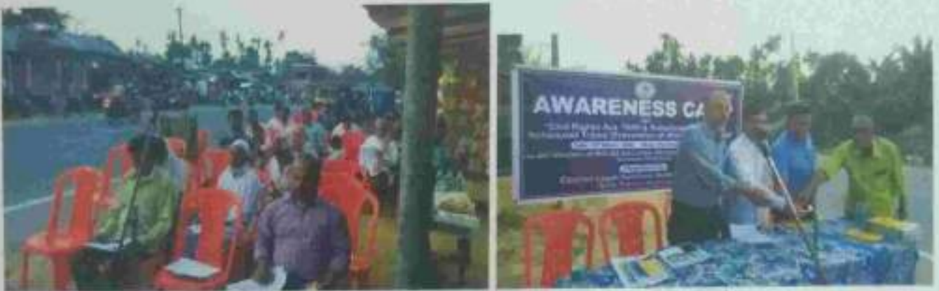
Awareness camp organised on 13 th March 2020 by DLSA, North Tripura District on Civil Rights Act.