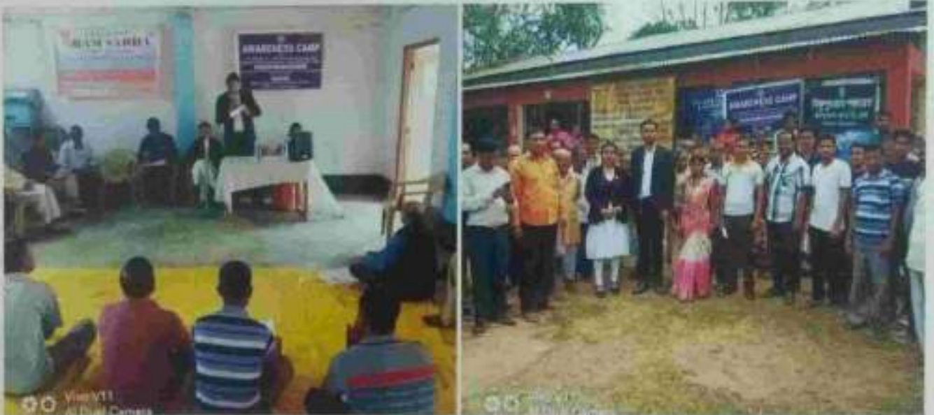
Awareness programme on 3 rd March 2020 at Dharmanager, DLSA, North Tripura District.