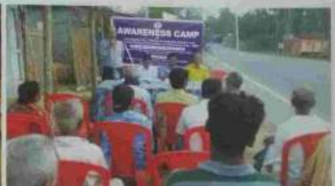
Awareness programme organised by SDLSC, Dharmanagar and DLSA, North Tripura District on various beneficial and welfare schemes and laws for the widows, differently abled, Senior Citizens and children at Dharmanagar and Panisagar, North Tripura on 11 march 2020. m workshop on Juvenile Justice Issues at Sonamura by DLSA, Sipahijala Tripura District.