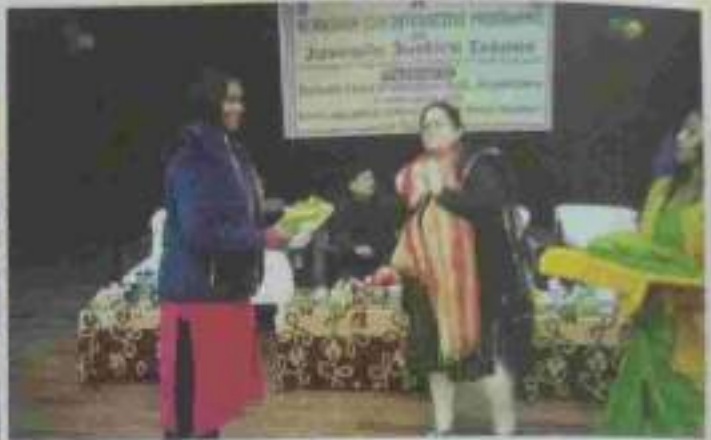
Awareness programme cum workshop on Juvenile Justice Issues at Sonamura by DLSA, Sipahijala Tripura District