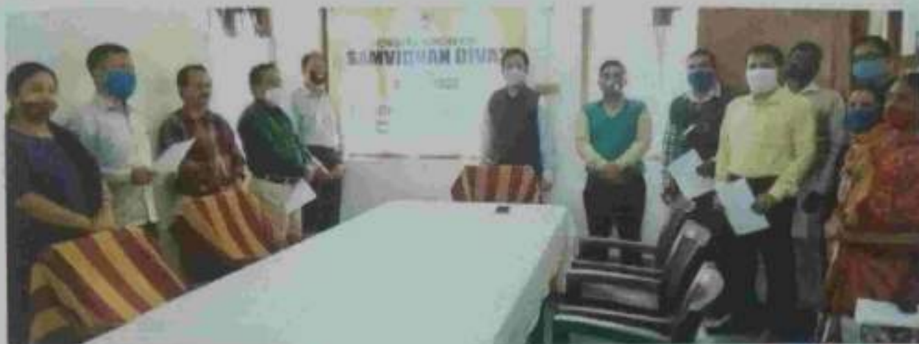
Reading of Preamble on 26 th November 2020 in the office of the Tripura State Legal Services Authority.