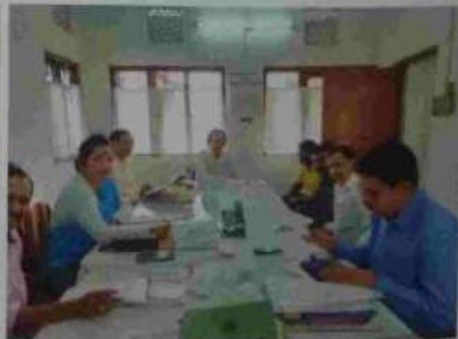
A glimpse of the Continuous Lok Adalat.