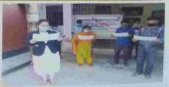
A glimpse of the reading of Preamble on 26 th November 2020, in the offices of HCLSC, High Court of Tripura, Agartala and in DLSAs & SDLSCs all over the state